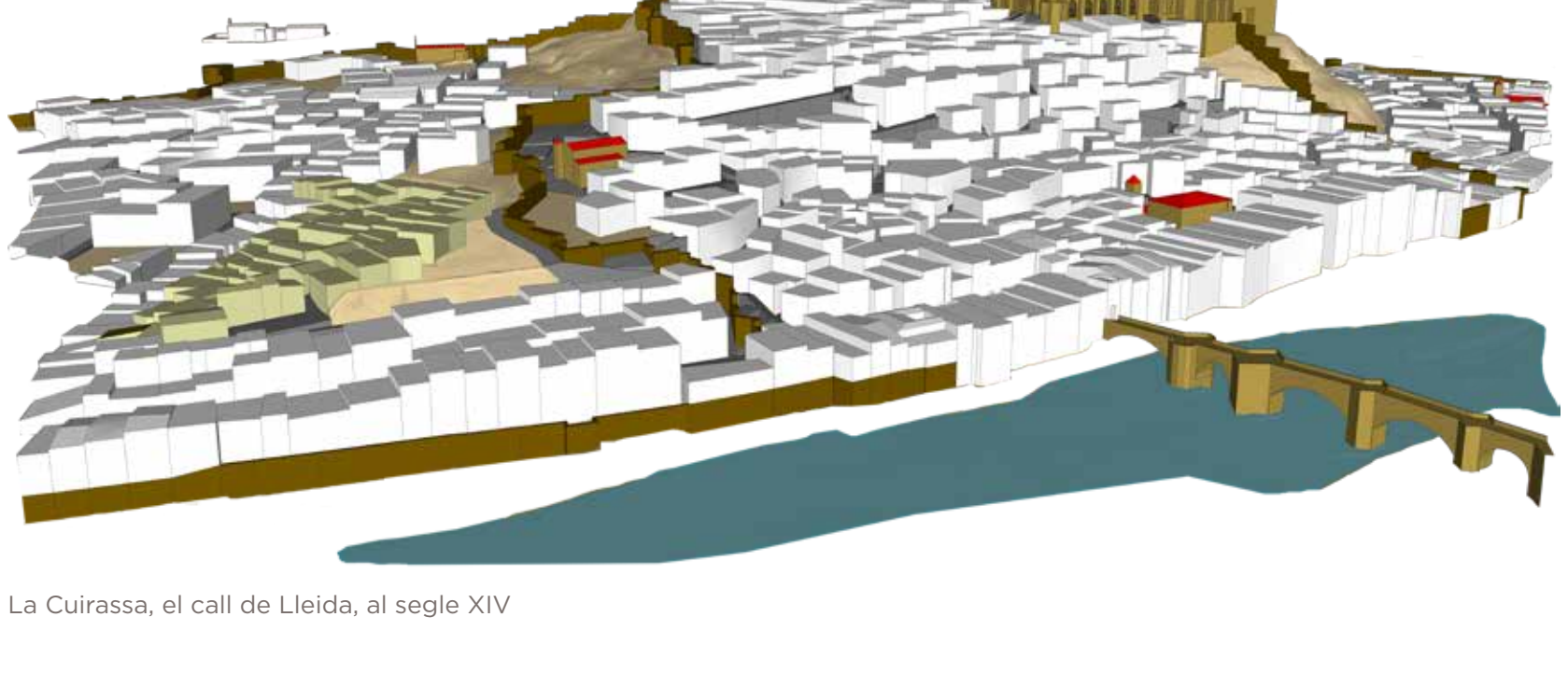
La Cuirassa, el call de Lleida, al segle XIV

No era un barri envoltat de muralles, però disposava de portes d'entrada. Viure junts facilitava als jueus seguir les seves tradicions i els protegia de la violència popular. La Cuirassa va arribar a ser una de les comunitats jueves més importants de la Corona d'Aragó, seu de la Col·lecta de Ponent, institució que administrava els assumptes de la comunitat jueva d'aquesta part del Principat. Es calcula que a mitjans del segle XIV vivien a Lleida al voltant de cinc-cents jueus, aproximadament el 13% del total de la població de Lleida.